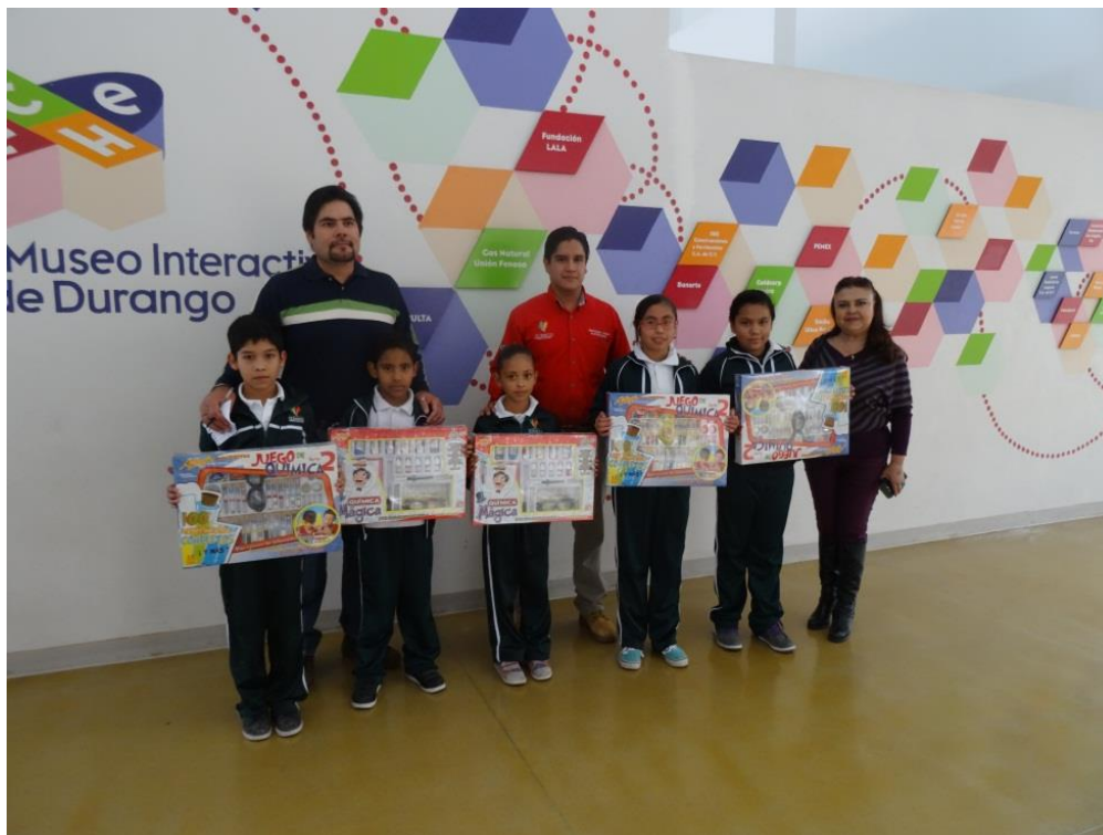
Ilustración 21: Juegos de química mágica y química 2.