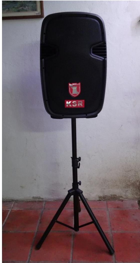
Ilustración 25: Equipo de sonido.