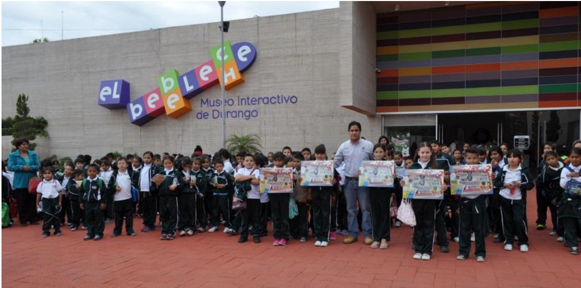
Ilustración 12: Visita guiada.