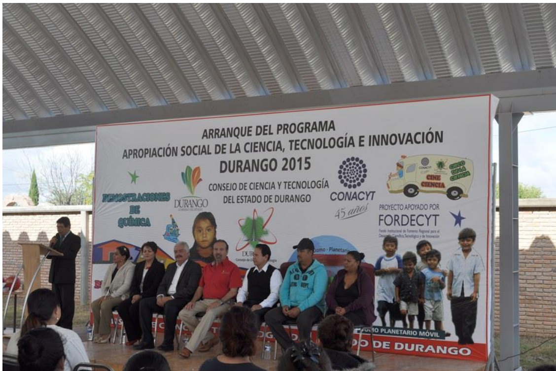
Ilustración 1: Inauguración del Programa de Apropiación Social de la Ciencia, Tecnología e Innovación 2015, en la escuela Cauhtémoc.

Cabe destacar que las actividades del programa se llevaron extraoficialmente desde el mes de abril pero fue hasta el mes de septiembre que se hizo el acto protocolario de inauguración.