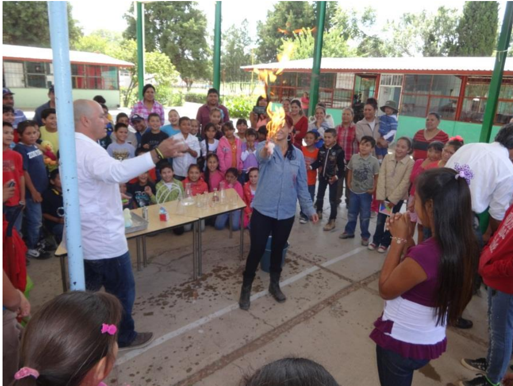
Ilustración 18: Experimento soplido mágico.