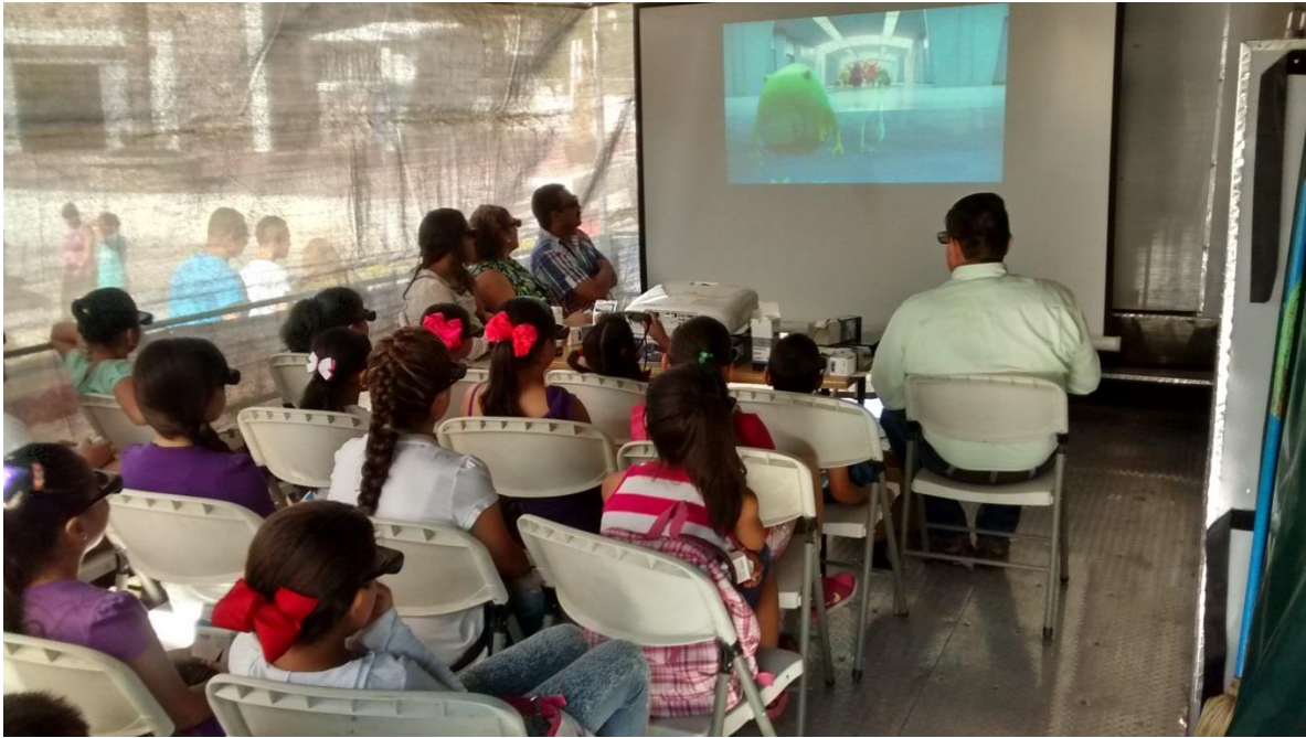
Ilustración 37: Tráiler en el municipio del Mezquital.