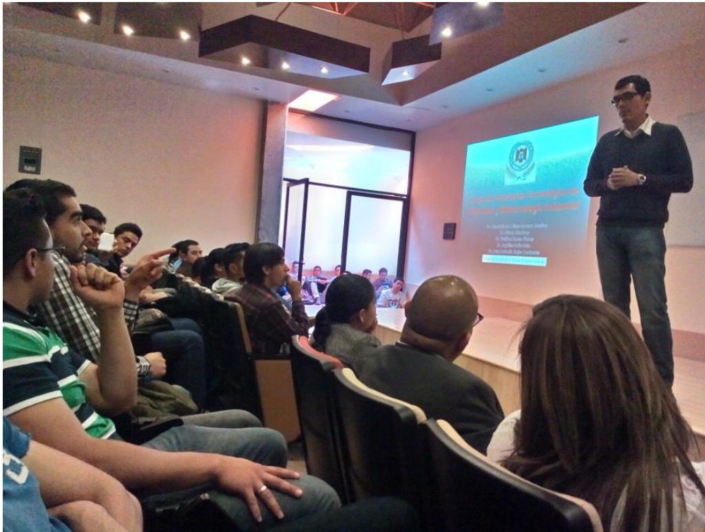
Ilustración 5: Conferencia Biolixiviación en la UAZ.

asociados y perspectivas” y “Biotecnología de minerales - Biolixiviación”, en la Universidad Autónoma de Zacatecas - Unidad Ciencias de la Tierra y la Universidad Politécnica de Zacatecas., se contó con la participación de 222 alumnos de las carreras de Ingeniería en Biotecnología e Ingeniería Minero Metalurgista, cumpliendo así el objetivo de contribuir al desarrollo científico, tecnológico y de innovación, propiciando acciones que facilitan la adquisición de habilidades de indagación expresión y comunicación, que permitan el descubrimiento y apropiación tanto de valores como de principios y metodologías brindando un espacio para el perfeccionamiento y profundización de saber.