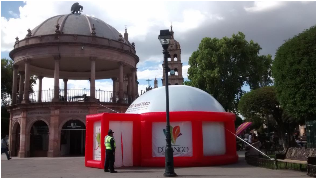
Ilustración 14: Domo planetario en plazas y escuelas públicas.

Así pues, desde el mes de julio se adquirió el domo planetario el cual se estuvo presentando en plazas, jardines, escuelas, cabeceras municipales, entre otros, exhibiendo películas en 3D con temas como: Astronomía, biología, geografía, matemáticas, entre otras, con un total de 142 funciones.