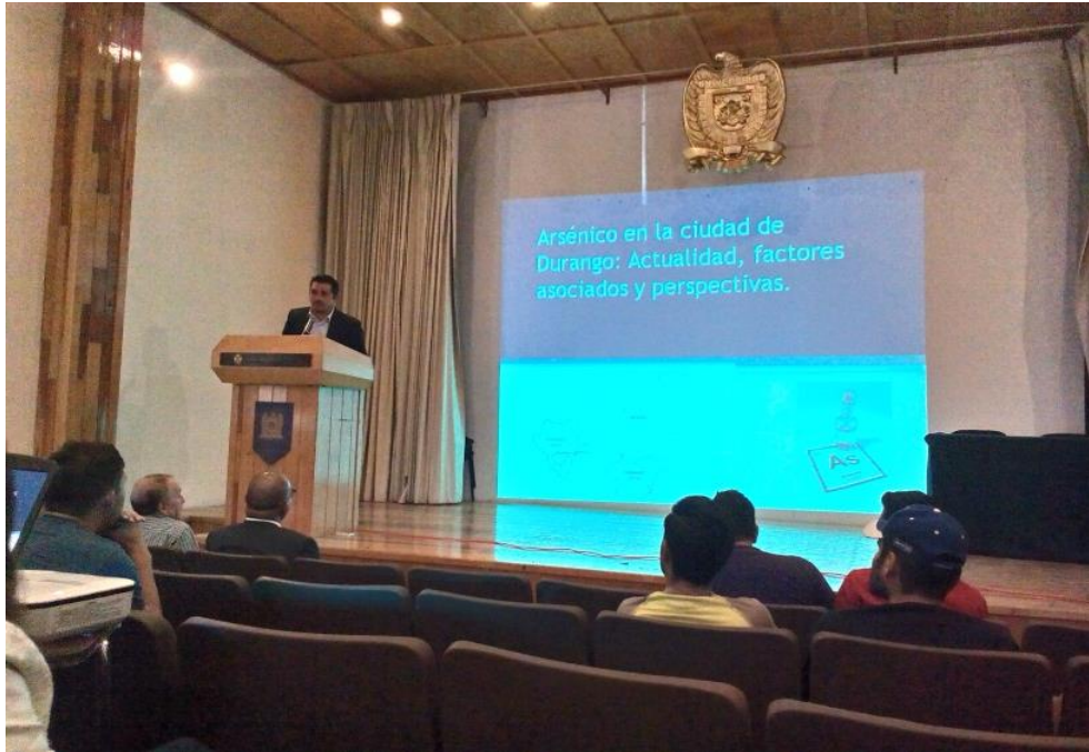
Ilustración 7: Conferencia Arsénico en la Ciudad de Durango en la UPZ.