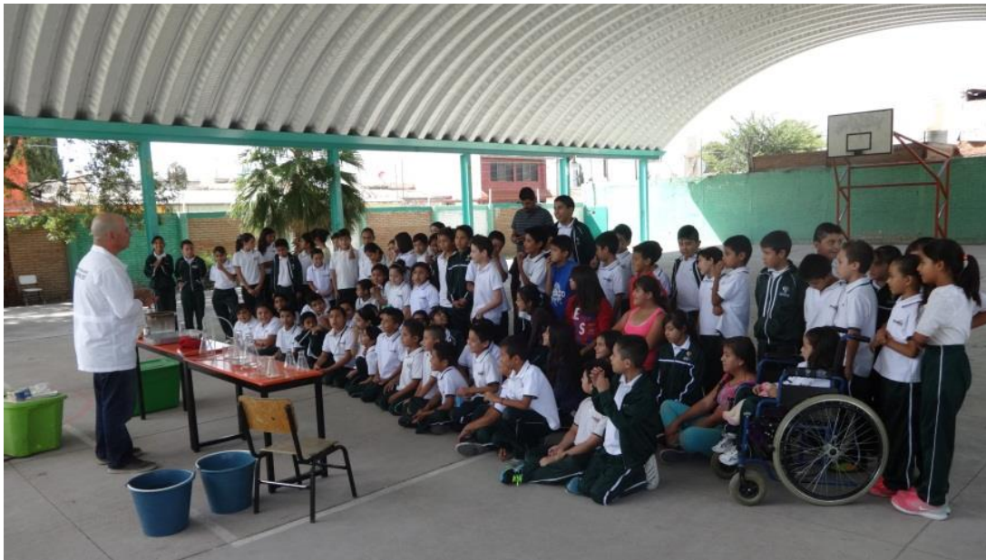
Ilustración 16: Demostraciones de experimentos científicos.