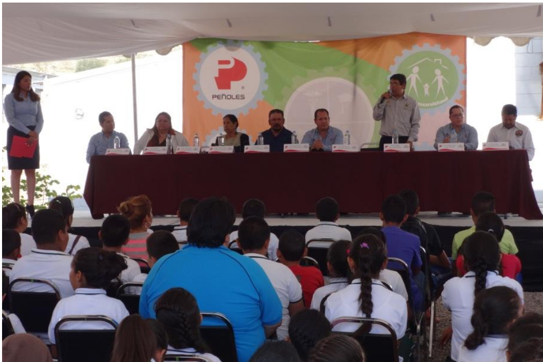
Ilustración 29: Inauguración de la Semana de Desarrollo Comunitario.